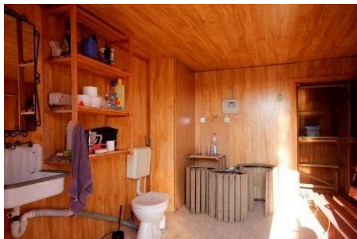
Sauna mit Bad (im Nebengebäude)