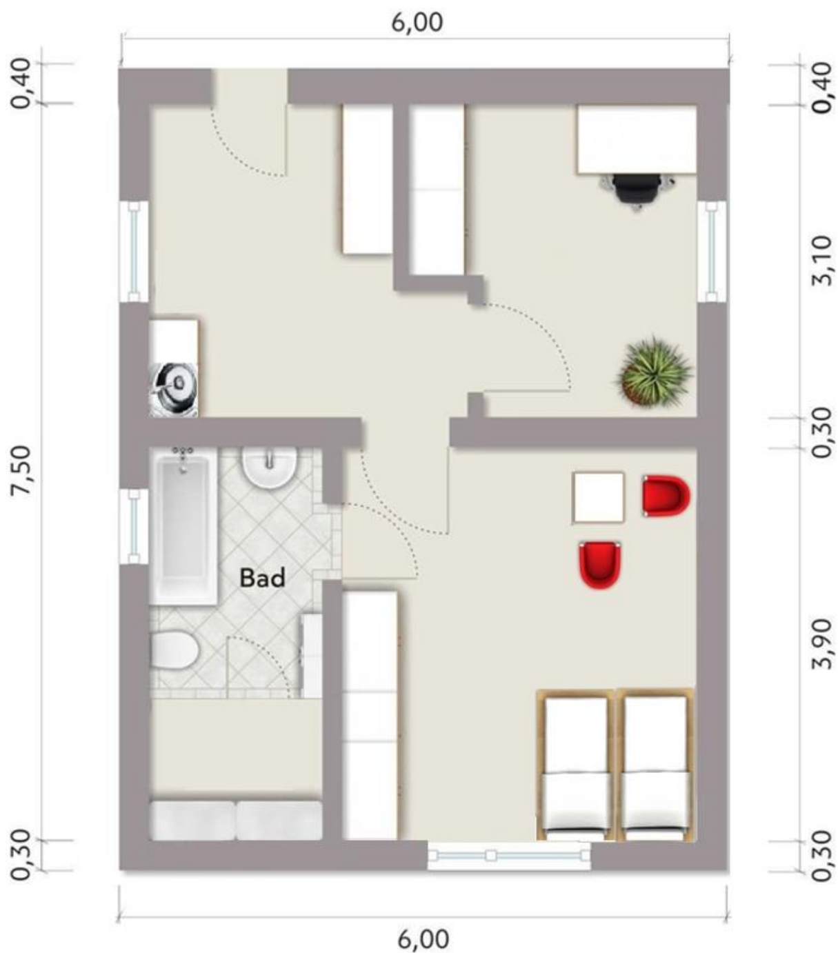
Grundriss der Wohnung