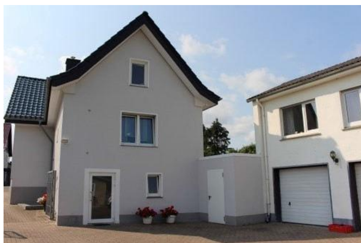
Blick von außen auf die Wohnung im Haupthaus