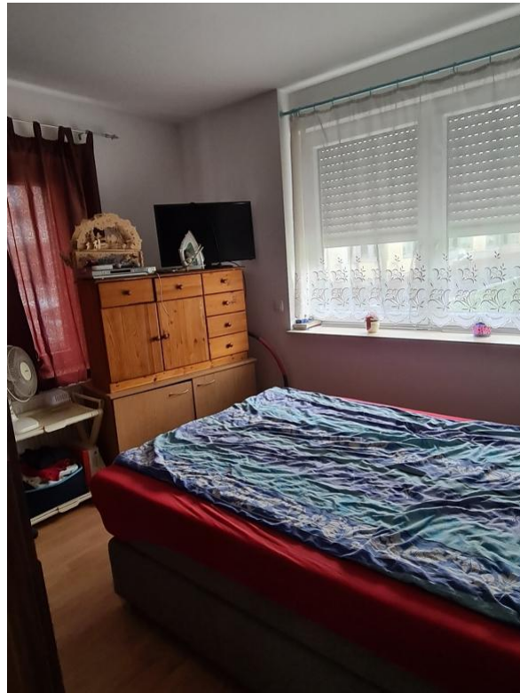
Zimmer 02 EG