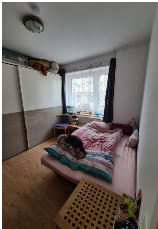
Zimmer 03 EG