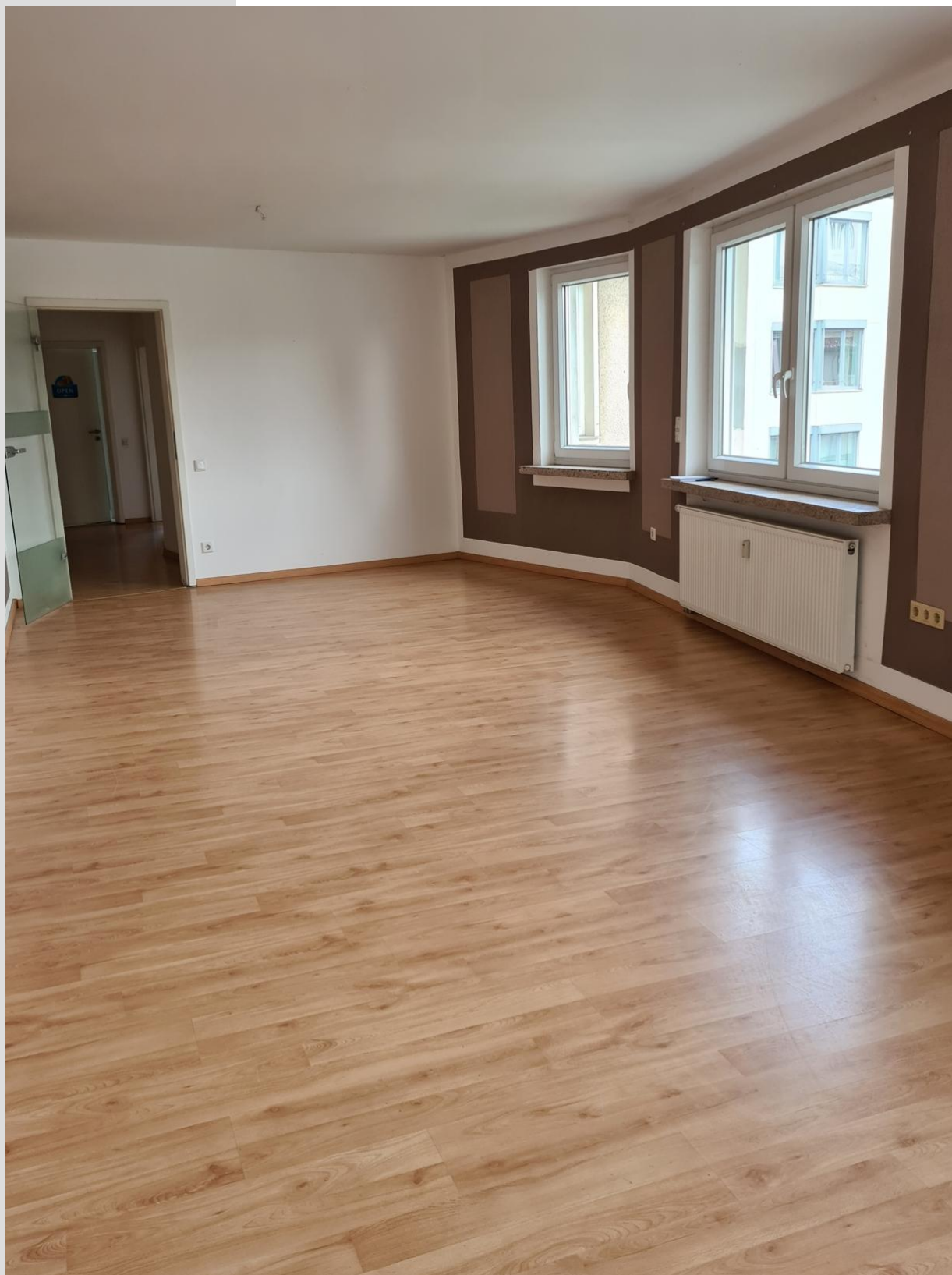
Zimmer 01 OG