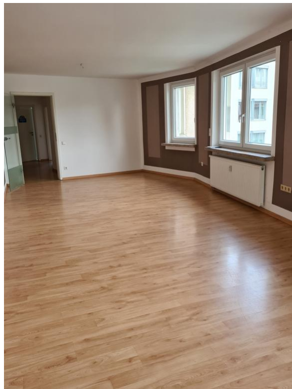
Zimmer 01 OG