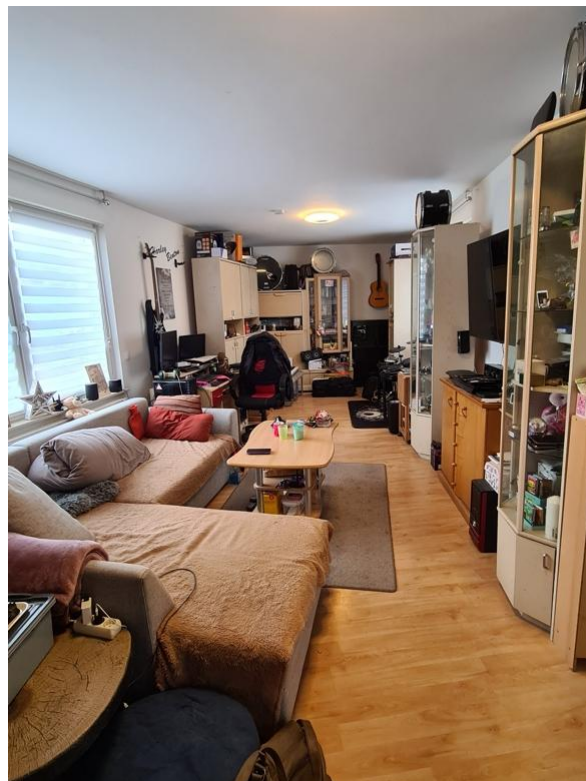
Zimmer 01 EG